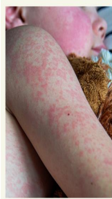
(2026. 6. 1 感染管理室)