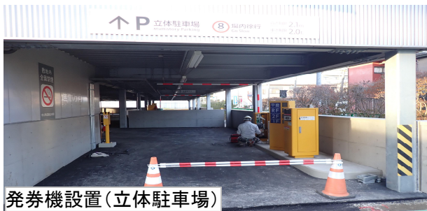
発券機設置（立体駐車場）