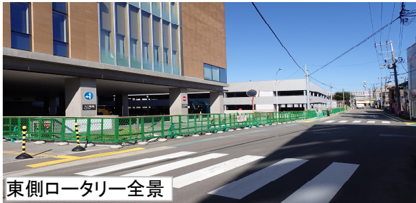
東側ロータリー全景