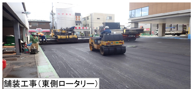
舗装工事（東側ロータリー）