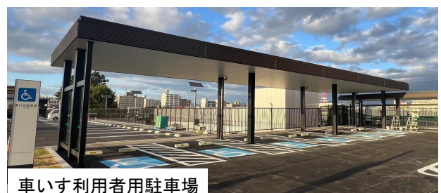
車いす利用者用駐車場