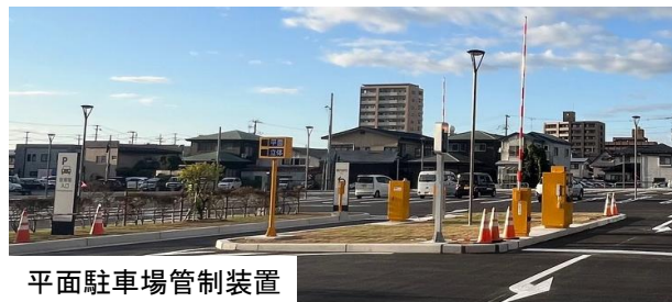
平面駐車場管制装置