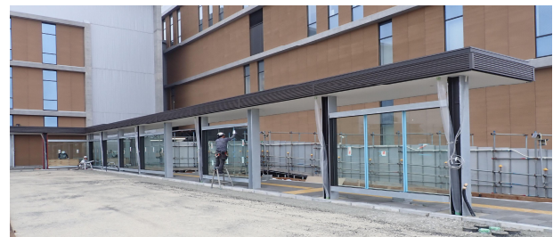
屋根付歩行者通路（バス停付近）

※工事に関する情報を町内会を通じて毎月お届けします。次回発行は8月末を予定しています。