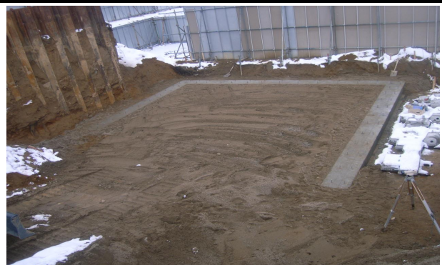
外構工事（土壁基礎）