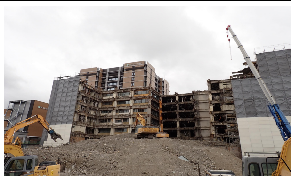
病棟（北側） 解体状況