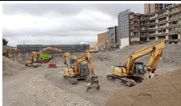
診療棟（地階） 解体状況