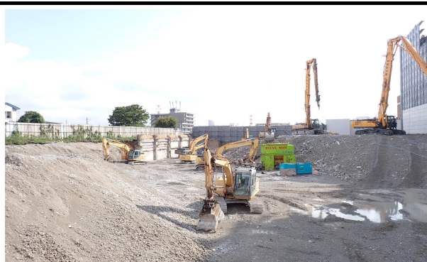
診療棟（地階） 解体状況