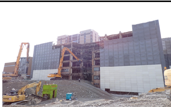
病棟（北側） 解体状況