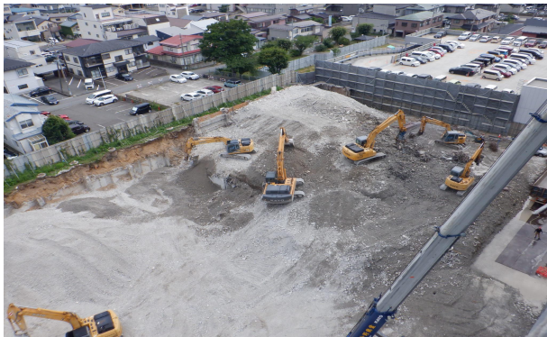
診療棟（地階） 解体状況