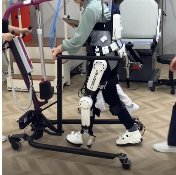
HAL ® を使用している患者さん