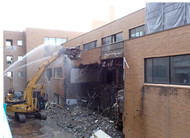
診療棟躯体解体状況