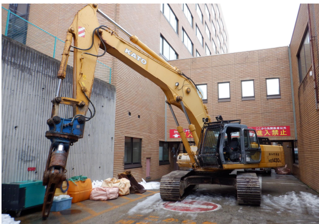
使用重機：油圧ショベル