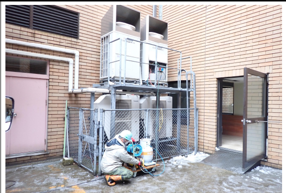
写真説明：屋外機冷媒ガス回収