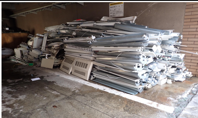
写真説明：照明機器類取外し