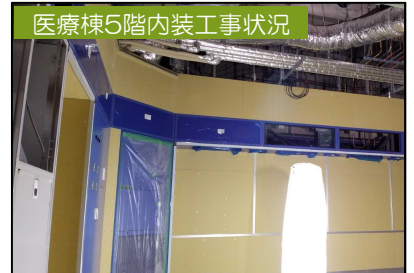
医療棟5階内装工事状況