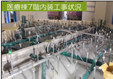
医療棟7階内装工事状況