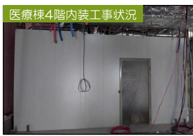
医療棟4階内装工事状況