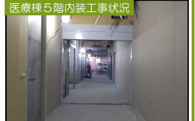
医療棟5階内装工事状況