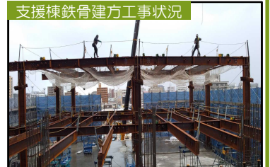
支援棟鉄骨建方工事状況