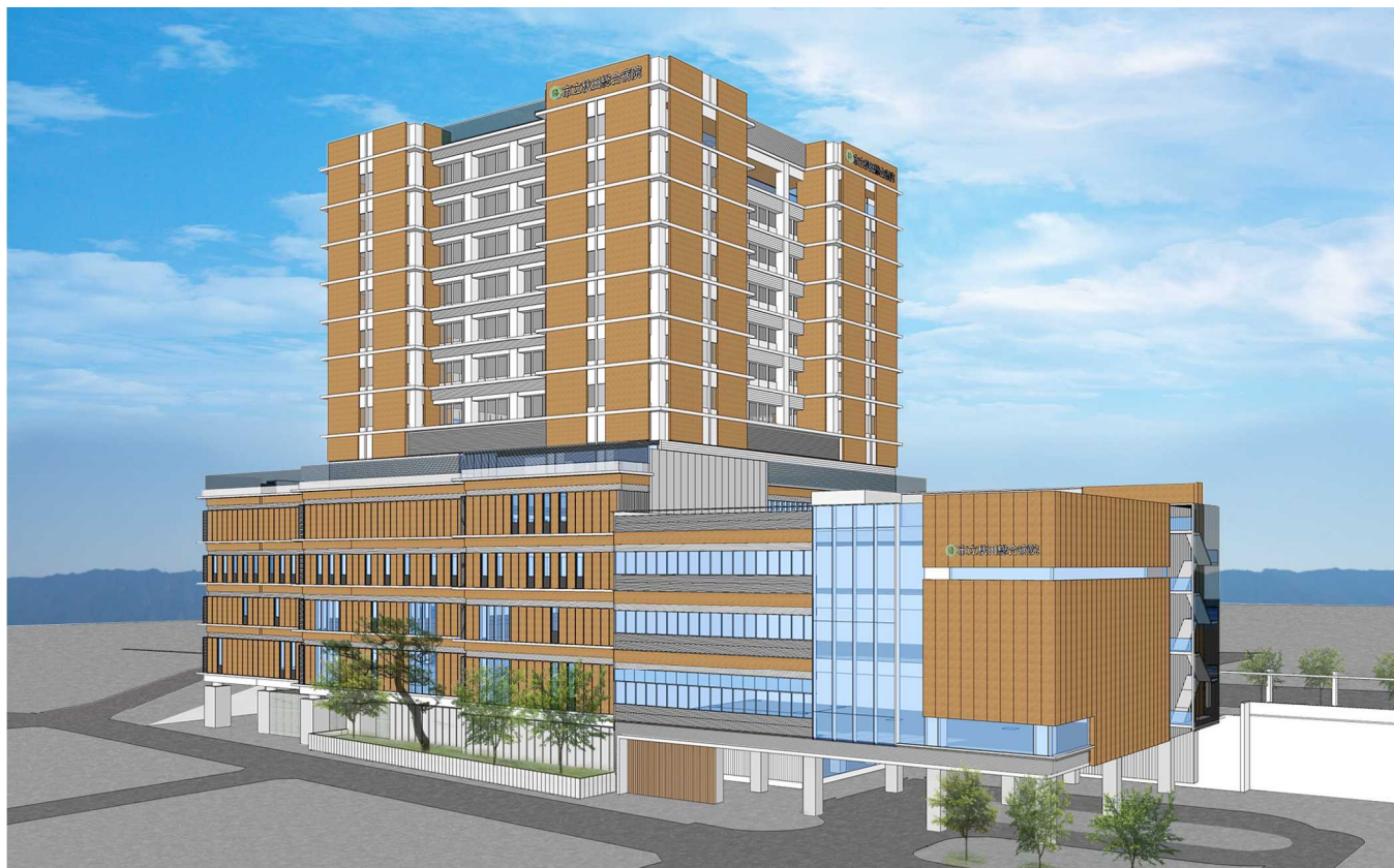
東側外観イメージ