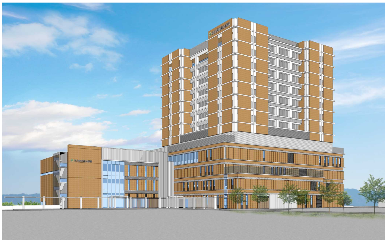
西側外観イメージ