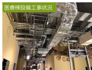
医療棟設備工事状況