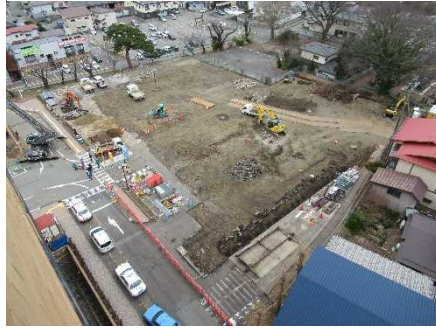
旧第1駐車場舗装撤去