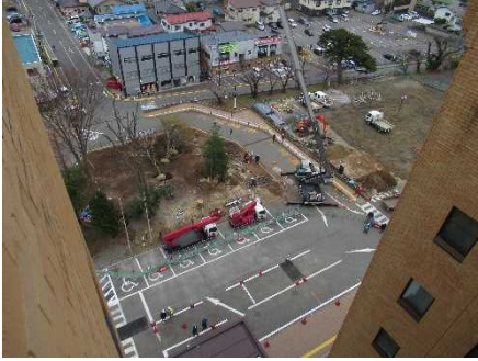
ロータリー部（植栽伐採・移植）